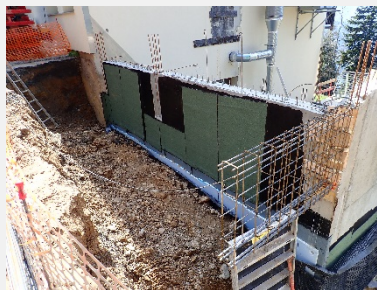
Etanchéité du mur côté chemin

La phase 2 des travaux, qui a commencé fin d'année 2018, est essentiellement l'installation d'un ascenseur permettant l'accès au centre aux personnes à mobilité réduite ainsi que l'isolation des murs.