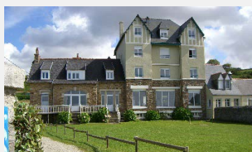
Centre Ker Avel (29)

Les petits + : 1 chalet avec cheminée ouverte et salle de restaurant panoramique