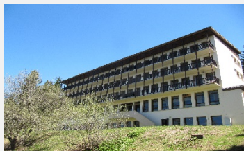
Centre Les Mainiaux (38)