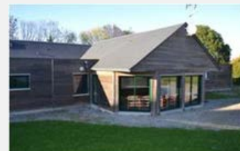
Centre La Charnie (53)

Les petits + : centre à 20 mètres de la plage et salle de restaurant panoramique avec vue sur la mer